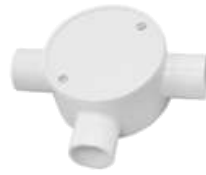
3 Ways Junction Box