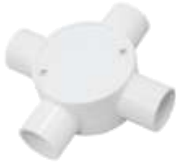
4 Ways Junction Box