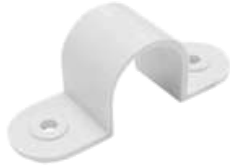
Clamp Pipe Omega