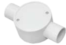
2 Ways Junction Box